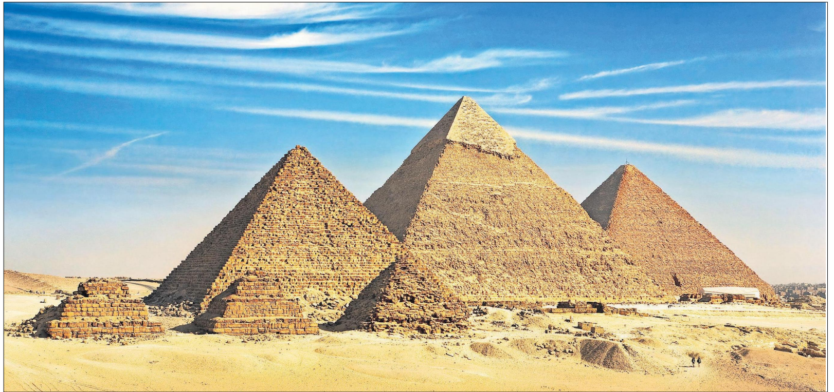
Die Pyramiden von Gizeh sind ein beeindruckendes Zeugnis der altägyptischen Hochkultur, zählen zu den bedeutendsten Bauwerken der Menschheitsgeschichte und sind heute Unesco-Weltkulturerbe.

In der 6. Episode des Podcasts Feuer & Flamme mit Gastgeber Robert Seeger und Elisabeth Kneissl-Neumayer dreht sich alles um Kairo. Zu hören überall, wo es Podcasts gibt, auch unter kneissltouristik.at