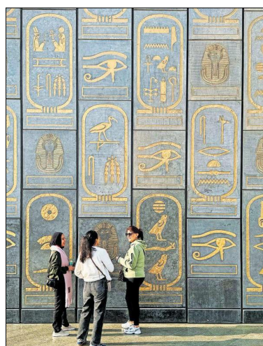
Das GEM, das größte archäologische Museum der Welt. [Elisabeth Kneissl-Neumayer]

Am Weg zu den Pyramiden von Gizeh legen wir einen Stopp bei der