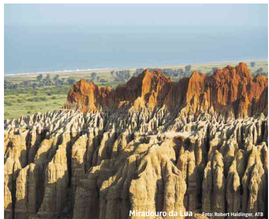
Miradouro da Lua

Alle Infos finden Sie durch Scannen des QR-Code.