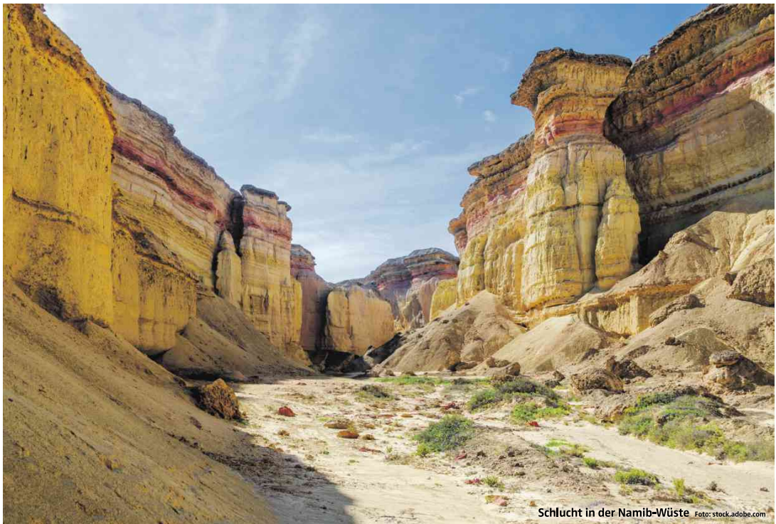
Schlucht in der Namib-Wüste

Noch ist Angola ein wenig bereites Land. Jahrzehntlang tobte hier nach der Unabhängigkeit von Portugal (1975) ein blutiger Bürgerkrieg, der bis 2002 dauerte. Angola versank im touristischen Dornröschenschlaf. Doch die