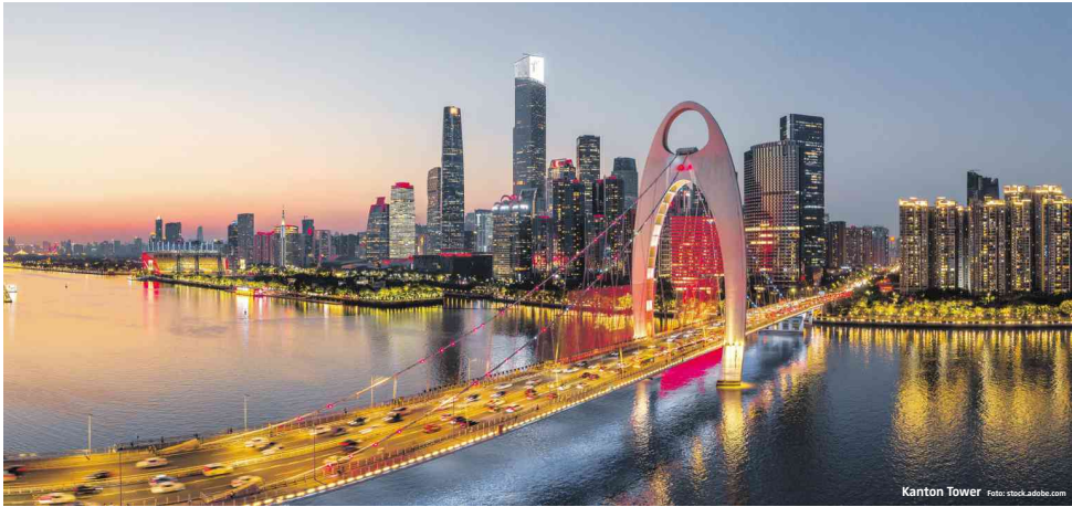
Kanton Tower