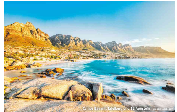
Camps Bay mit Tafelberg und 12 Aposteln

Ebenfalls ein Muss entlang der Route sind die Boulders bei Simonstons. 1982 haben sich hier 2 Brutpaare von Brillenpinguinen niedergelassen, damit begann der Aufstieg dieser „putzigen“ Pinguinart, die zu Hunderttausenden die Küsten der False Bay bevölkert. Überfischung, Wasserverschmutzung und Klimawandel haben sie auf gut 10.000 reduziert. Von den Aussichtsplattformen kann man die ca. 45 cm großen Pinguine perfekt beobachten. Einer der schönsten Aussichtspunkte auf die Küsten der Kaphalbinsel bietet sich bei Camp's Bay, die einzigartigen Felsformationen über den Sandstränden des Ortes, am Fuß der Bergkette der Zwölf Apostel, sind einfach atemberaubend schön.