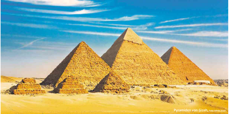
Pyramiden von Gizeh

Gehen wir in der Geschichte etwas weiter, landen wir in der Zeit der Fatimiden, die 972 ihre Hauptstadt nach Kairo verlegten und von hier aus ganz Nordafrika regierten. Nördlich der Ibn-Tulun-Moschee liegt die al-Muizz-Straße, die älteste Straße von Kairo und das Kerngebiet des UNESCO-Welterbes „Historisches Kairo“, das sich vom alten Stadttor Bab al-Futuh im Norden durch den Khan el-Khalili Souk bis zum Bab Zuweila und darüber hinauszieht. Unter den Fatimiden entstanden hier erste Paläste und Moscheen sowie die mächtige Stadtmauer. Die prachtvollsten Bauten verdanken wir aber den Mameluken, die als zentralasiatische Söldner ins Land geholt worden waren. Ab 1250 bestimmten wie als Sultane für knapp 270 Jahre die Geschichte des Landes und die Architektur des historischen – islamischen Kairo. Herausragend ist der Qalawun-Komplex, primär ein Spital, das mit dem Mausoleum und einer Madrasa (Koranschule) erweitert wurde. Das 1285 fertiggestellte Mausoleum begeistert mit Marmorinlegearbeiten, schönen Holzdecken, Buntglasfenstern und Gipschnidkerei, für mich der stimmigste Bau im islamischen Kairo. 70 Jahre später wurde die damals größte Moschee der islamischen Welt, die Sultan-Hassan-Moschee am Fuß des Zitadellenhügels errichtet. Auch hier hat man die besten Hand-