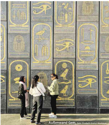
Außenwand GEM, Foto: Elisabeth Kneissl-Neumayer

ägyptischen Epochen von den Ursprüngen bis zu den Römern, jeweils unterteilt in Alltagsleben, Königshaus und Götterwelt. Die Exponate sind großartig präsentiert und ermöglichen einen guten Überblick. Daneben ist endlich ausreichend Platz für die wunderbaren Grabbeigaben des Tutenchamun. Wer im Tal der Könige in seinem sehr kleinen Grab stand, tut sich allerdings schwer zu glauben, dass sich all diese Gegenstände dort hineingepasst haben. Man kann im GEM auch den Nachbau der grandiosen Sonnenbarke des Pharaos Cheops bewundern, der aus Zederholz originalgetreu zusammengesetzt wurde. Beim Eingang beeindruckt die fantastische 11 m hohe Kolossalstatue von Ramses II. auf der Grand Staircase Statuen und Sarkophage. Für mich sind Nachmittag und Abend an den langen Öffnungstagen die beste Besuchszeit, dann sind nur mehr wenige Besucher in den Hallen, dann sinkt der Lärmpegel und man hat das Gefühl, allein der ägyptischen Geschichte gegenüberzustehen.