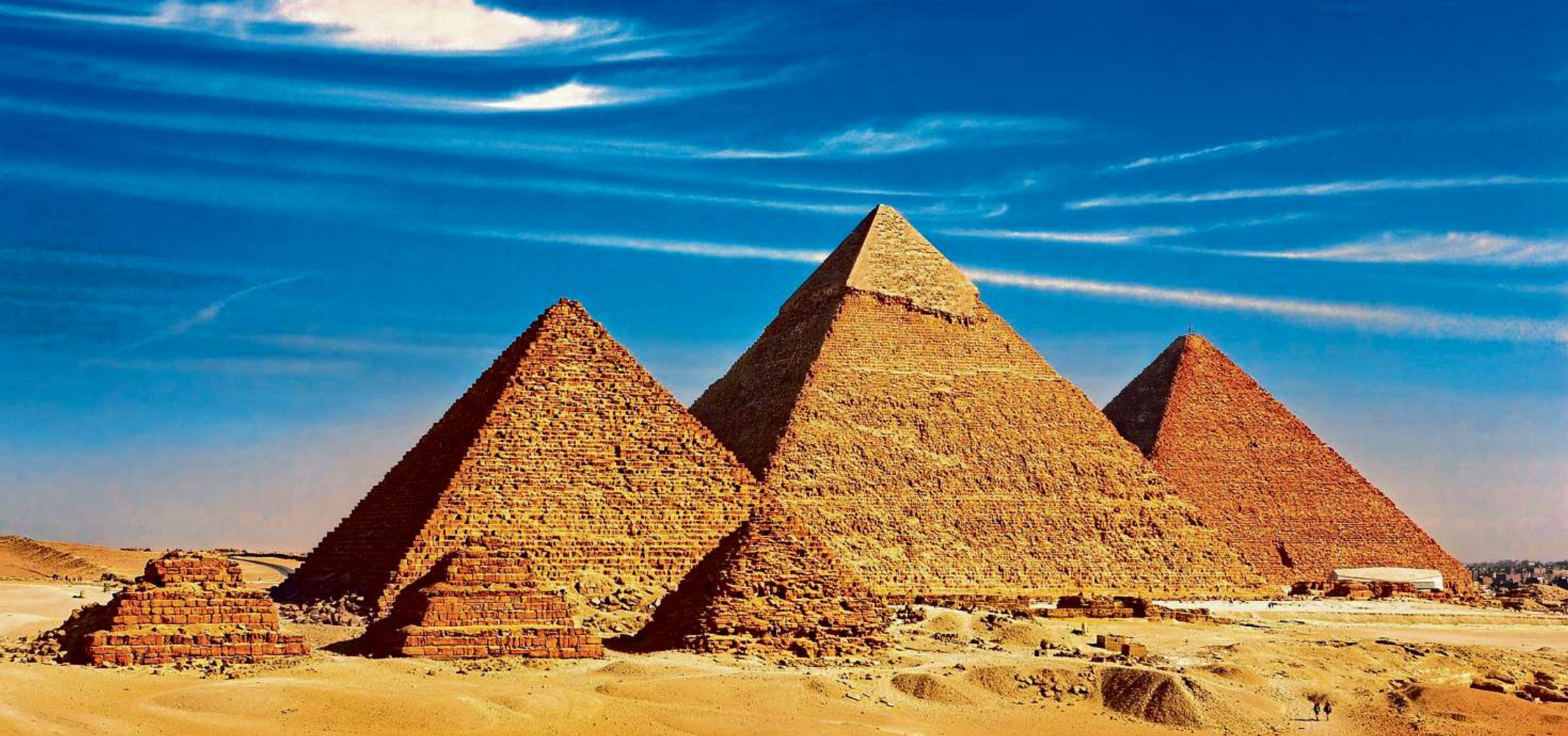
Pyramiden von Gizeh