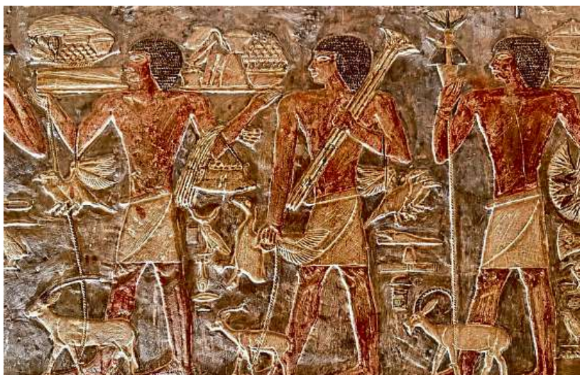
Sakkara, Grab des Mereruka, © Elisabeth Kneissl-Neumayer

Am Weg zu den Pyramiden von Gizeh legen wir einen Stopp bei der Aga Khan Foundation ein – die Wissa Wassef Schule wurde in den 50er Jahren des 20. Jahrhunderts vom Architekten Ramses Wissa