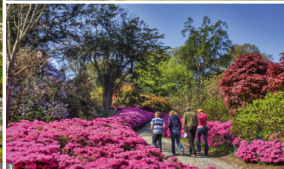
1 Rock of Cashel 2 Dingle, Sleah Head Drive 3 Rhododendronblüte - Ende Mai/Anfang Juni