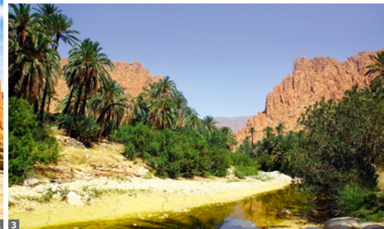
1 Timgad 2 römisches Mosaik 3 El Kantara