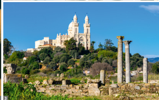
1 Grand Erg Oriental 2 El-Atteuf/M'Zab Tal bei Ghardaia 3 Hippo Regius

7. Tag: Biskra - El Oued. Eine lange Fahrstrecke bringt uns nach El Oued - UNESCO-Welterbe dank der einzigartigen Dünen und Oasenkultur am Rande des Grand Erg. Am Nachmittag unternehmen wir einen Ausflug mit Geländefahrzeugen in diese einzigartige Welt prachtvollster Dünenkämme, aber auch intensiver Landwirtschaft, die dank der ausgeklügelten Ghout-Technik funktioniert.