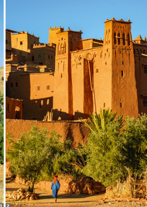
1 Tafraoute, Tal der Ammeln 2 Aït-Ben-Haddou

13. Tag: Tafraoute - Tiznit - Marrakesch. Über den landschaftlich reizvollen Col du Kerdous erreichen wir Tiznit, bekannt für seine Souks der Waffenschmiede und Silberschmuckhersteller. Auf der Schnellstraße folgen wir den Ausläufern des Hohen Atlas nach Marrakesch. Am Abend erleben wir den Platz Djemaa el Fna mit seinen Märchen-erzählern, Gauklern und Schlangenbeschwörern.