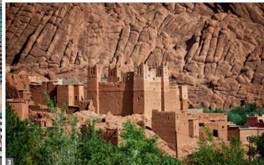
1 Atterine Medersa, Fès 2 Rabat Chellah 3 Dades-Tal

gitana zeugen. Vorbei an der heiligen Stadt Moulay Idriss (Fotostopp) erreichen wir mittags die Königsstadt Meknès, deren Schönheit aufgrund der zahlreichen Renovierungsarbeiten im Moment kaum zu sehen ist: Inmitten der wuchtigen Festungsmauern liegt die Altstadt mit ihren Souks und besticht mit einzigartigem Ambiente, u.a. bei der Grabmoschee des Stadtgründers Moulay Ismail.