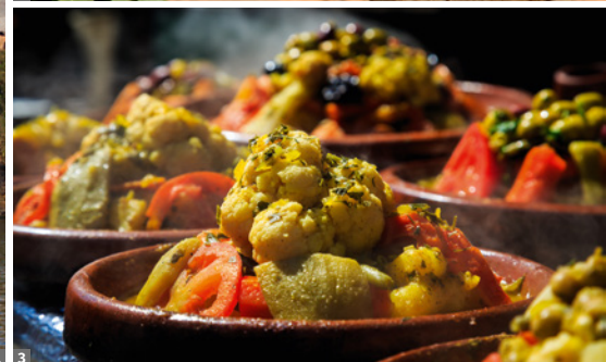
1 Rabat, Kasbah Oudaïas 2 junges Kamel 3 Tajine