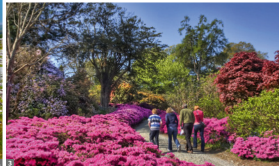
1 Burren, Poul nabrone Dolmen © stock.adobe.com 2 Dunguaire Castle © stock.adobe.com 3 Rhododendronblüte - Ende Mai/Anfang Juni © Tourism Ireland