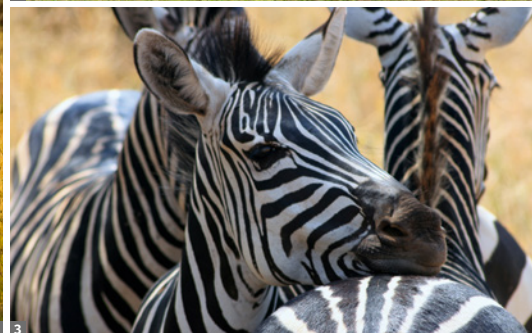
1 Jeepsafari 2 Gnuherde in der Serengeti 3 Tarangire Nationalpark

12. Tag: Lake Manyara Nationalpark - Mto Wa Mbu Village - Tarangire Nationalpark. Das lebhaftes Dorf Mto Wa Mbu ist ein fantastischer Ort für einen kulturellen Ausflug zwischen den Tierbeobachtungen. Wir bestaunen authentische tansanische Kultur und erleben die Gastfreundschaft der Bewohner. Das Dorf ist bekannt für seine farbenfrohen Märkte, die Vielzahl lokaler Produkte, Kunsthandwerk und kulinarischen Delikatessen.