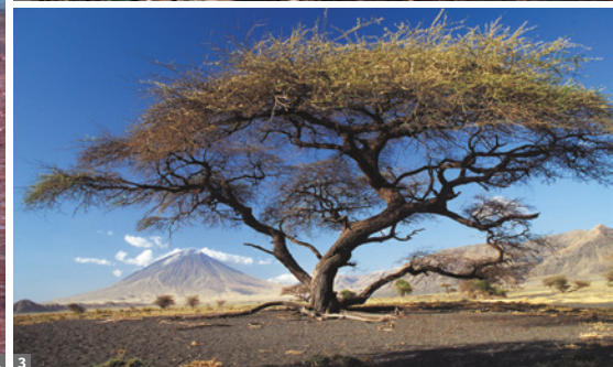
1 Flamingos am Lake Natron 2 Geparden-Familie 3 Ol Doi nyo Lengai Vulkan