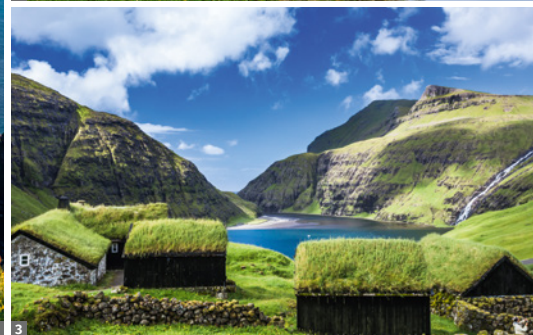
1 Kallur-Leuchtturm 2 Papageitaucher 3 Saksun

das mit seinen grasgedeckten Häusern und wegen der traumhaften Lage vielen als das schönste Dorf der Färöer gilt. Man hat das Gefühl, in eine Filmlandschaft einzutauchen. Bei Ebbe Wanderung in die Bucht. Von der Ortschaft Tjørnuvík mit ihren Stränden hat man schließlich einen schönen Blick auf die markante Felsformation „Riese und Trollweib“. Anschließend Rückkehr nach Tórshavn.