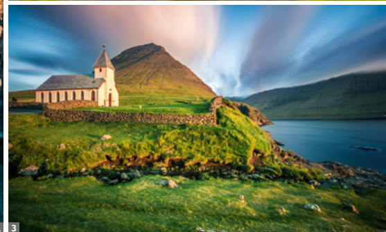
1 Gásadalur 2 Kirkjubøur 3 Viðareiði