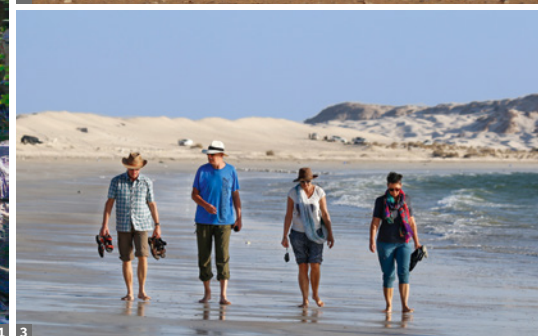
1 Bergoasen © Anton Eder 2 weiße Oryx © Anton Eder 3 Strand und Dünen bei al-Khaluf © Anton Eder

Oryx-Antilopen Aufzuchtstation, wo wir Gazellen und weiße Oryx-Antilopen beobachten können. Übernachtung im einfachen Hotel in Haima, dem Hauptort der Region al-Wusta, wo wir die Treibstoffvorräte auffüllen.