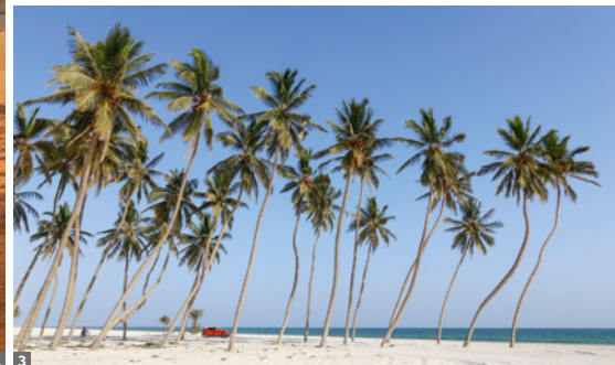
1 Nachtlager in der Rub al-Khali © Anton Eder 2 „Steinwald“ bei Duqm © Anton Eder 3 Strand von Salalah © Anton Eder