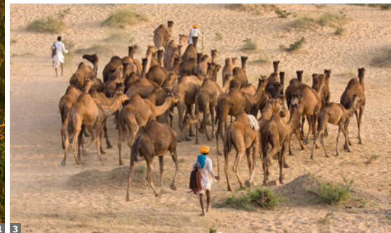
1 Udaipur 2 Spiegelmosaik 3 Auf dem Weg zum Pushkar-Fest