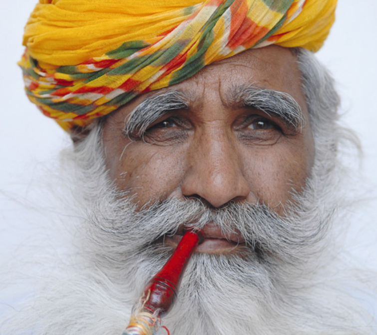
Jodhpur, Palastwächter