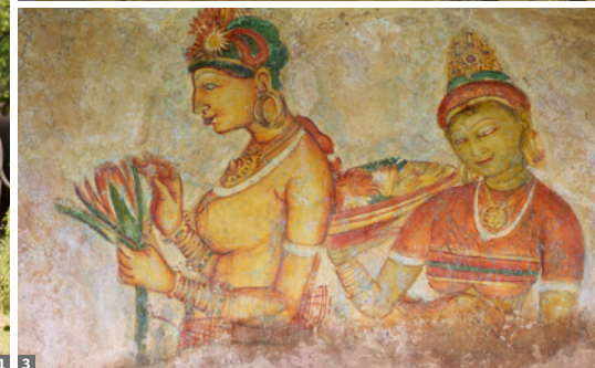
1 Minneriya 2 Dagoba, Anuradhapura 3 „Wolkenmädchen“

Devons und St. Clairs. Transfer zum Hotel in der Nähe des Flughafens - Abendessen. Das Hotelzimmer steht bis zur Abreise zur Verfügung. 11. Tag: Colombo - Doha - Wien/München/Frankfurt. Nach Mitternacht Transfer zum Flughafen - Abflug um ca. 04.55 Uhr nach Doha, Ankunft um ca. 07.25 Uhr. Weiterflug um ca. 09.15 Uhr nach Wien, München oder Frankfurt, wo man am frühen Nachmittag landet (ca. 14.05 Uhr).