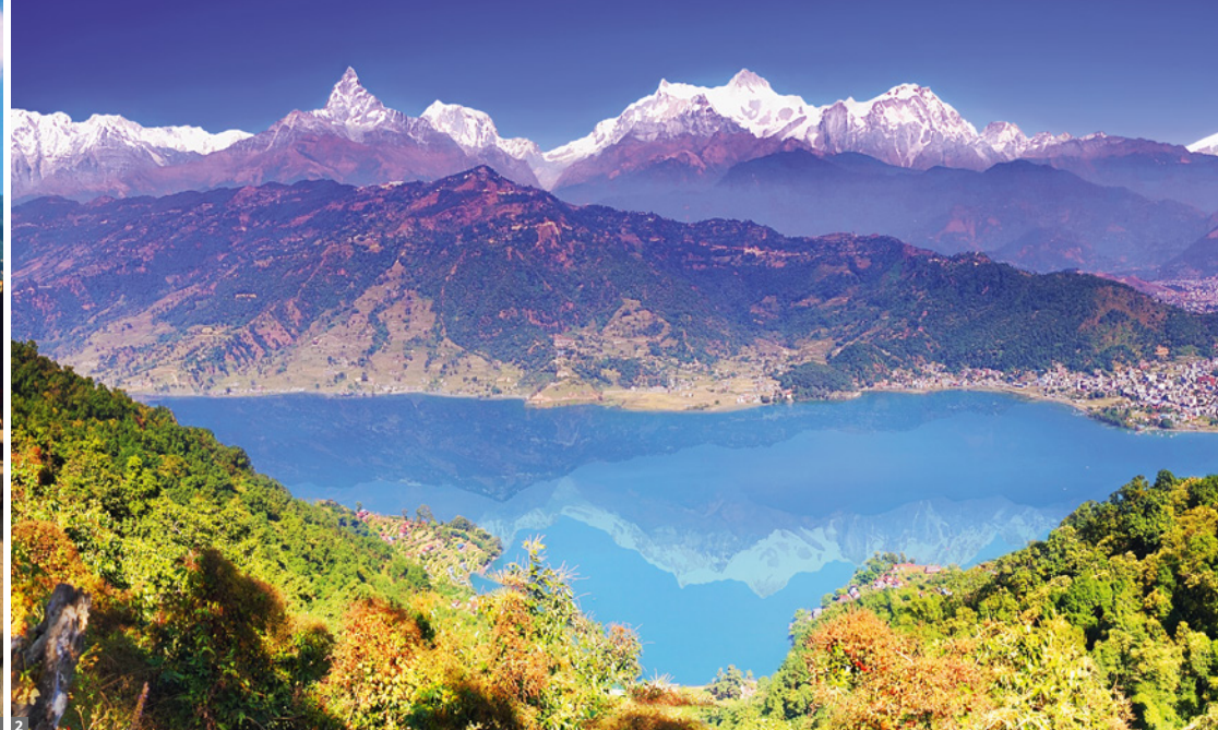
1 Bhaktapur 2 Pokhara, Phewa See u. Annapurna-Massiv