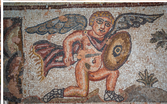
1 St. Hilarion, Nordzypern 2 Akamas 3 Paphos