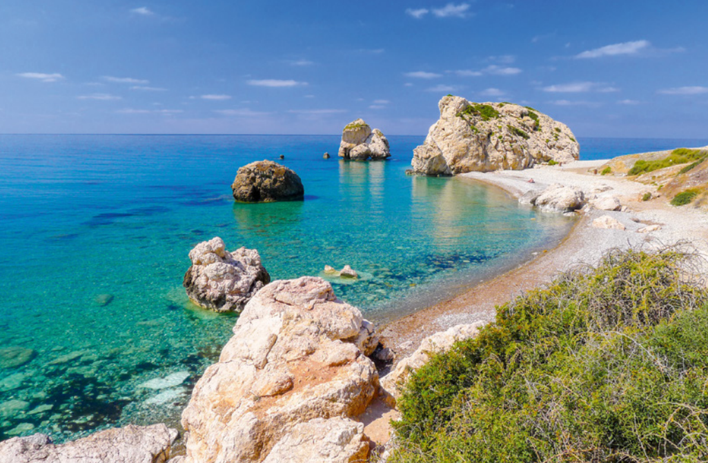
Petra tou Romiou

einer urigen Taverne im Dorf Kathikas. Wanderung ca. 11 km/ca. 4 Std., ca. 450 m ↑, 350 m ↓.