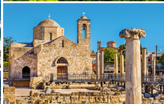
2 Troodos-Gebirge 3 Paphos

che zu sehen. Ein letzter Abstecher führt zur kleinen Moschee Hala Sultan Tekke am Ufer des Salzsees nahe Larnaca.