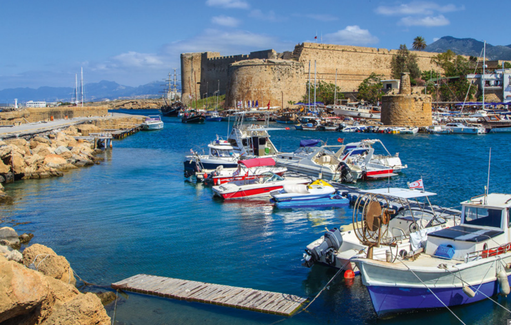
1 Kyrenia